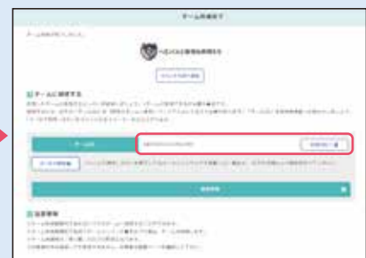
③ チームが作成されチーム戦への参加が完了。「チームID」を仲間に伝え、チームに招待しましょう。