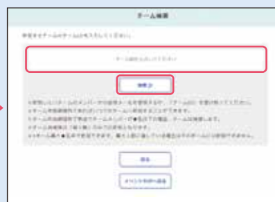
② 参加したいチームの「チームID」を入力し、「検索」ボタンをクリック。