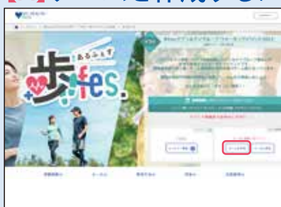
① イベント概要ページの「チームを作成」ボタンをクリック。