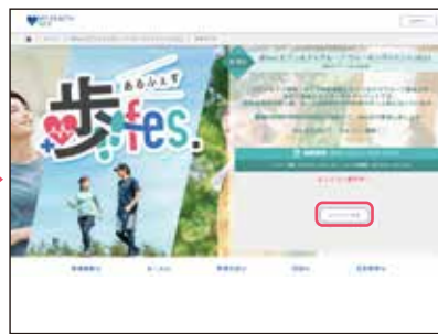
● イベント概要ページの「エントリーする」ボタンをクリック。