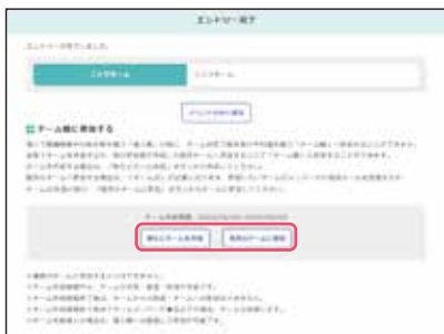
● エントリーが完了。チーム戦に参加したい方は、「新たにチームを作成」もしくは「既存のチームに参加」をクリックします。続きの操作は、下記【A】【B】②③をご参照ください。