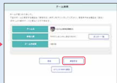
③ 表示されたチームに参加する場合は、「参加する」ボタンをクリックし、チーム戦参加が完了。