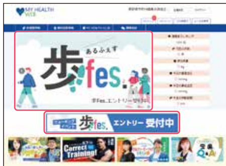
● MY HEALTH WEBへログイン後、TOPページ内バナーよりエントリーページに遷移。