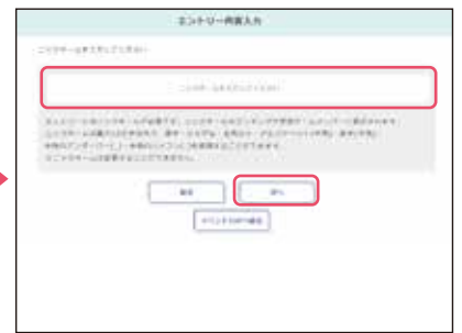
● ニックネームを入力し、「次へ」ボタンを押下し、画面の指示に従って進みます。