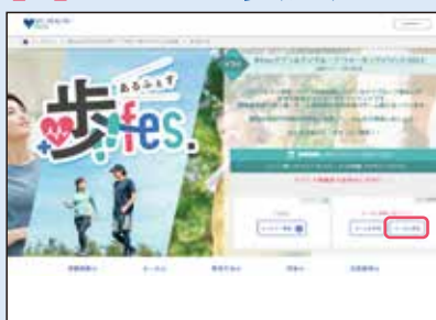
① イベント概要ページの「チームに参加」ボタンをクリック。