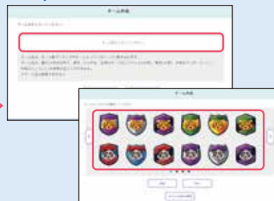
② 画面の指示に従い「チーム名」「チームエンブレム」を設定。