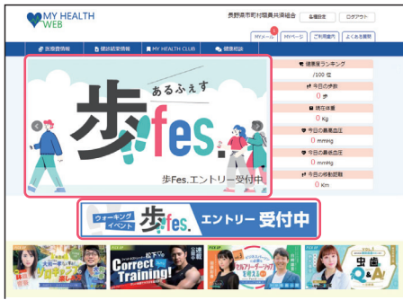
● MY HEALTH WEBへログイン後、TOPページ内バナーよりエントリーページに遷移。