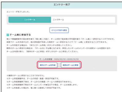
● エントリーが完了。チーム戦に参加したい方は、「新たにチームを作成」もしくは「既存のチームに参加」をクリックします。続きの操作は、下記【A】【B】②③をご参照ください。