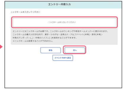
● ニックネームを入力し、「次へ」ボタンを押下し、画面の指示に従って進みます。