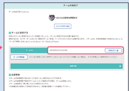
③ チームが作成されチーム戦への参加が完了。「チームID」を仲間に伝え、チームに招待しましょう。