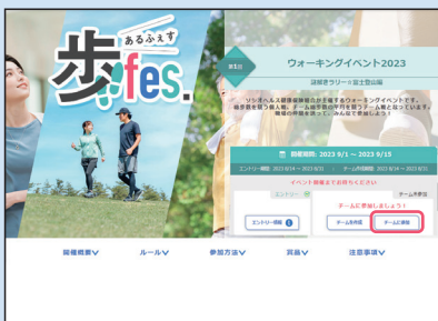
① イベント概要ページの「チームに参加」ボタンをクリック。