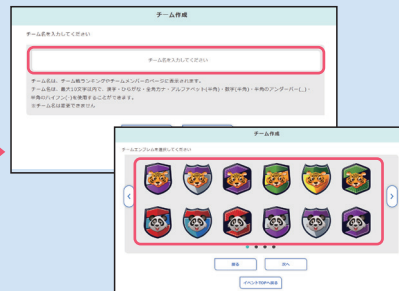
② 画面の指示に従い「チーム名」「チームエンブレム」を設定。