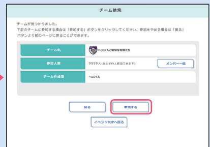
③ 表示されたチームに参加する場合は、「参加する」ボタンをクリックし、チーム戦参加が完了。