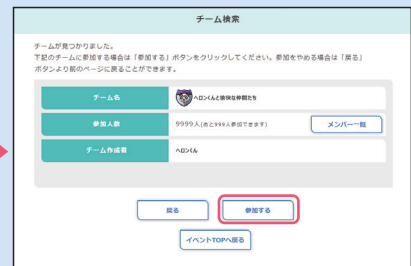
③ 表示されたチームに参加する場合は、「参加する」ボタンをクリックし、チーム戦参加が完了。