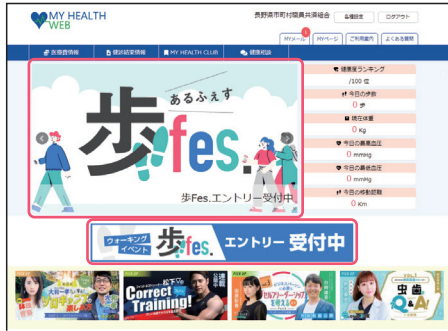
● MY HEALTH WEBへログイン後、TOPページ内バナーよりエントリーページに遷移。