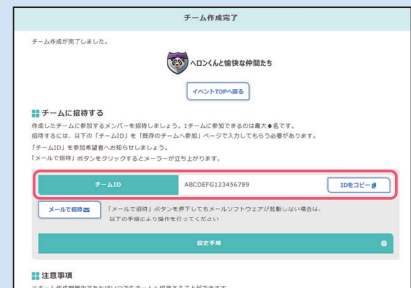
③ チームが作成されチーム戦への参加が完了。「チームID」を仲間に伝え、チームに招待しましょう。