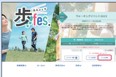
① イベント概要ページの「チームに参加」ボタンをクリック。