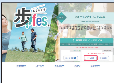
① イベント概要ページの「チームを作成」ボタンをクリック。