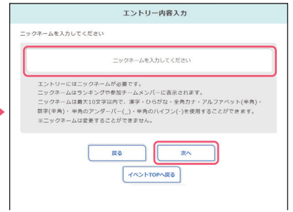
● ニックネームを入力し、「次へ」ボタンを押下し、画面の指示に従って進みます。