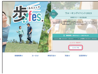
● イベント概要ページの「エントリーする」ボタンをクリック。