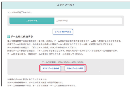
● エントリーが完了。チーム戦に参加したい方は、「新たにチームを作成」もしくは「既存のチームに参加」をクリックします。続きの操作は、下記(A)(B)②③をご参照ください。