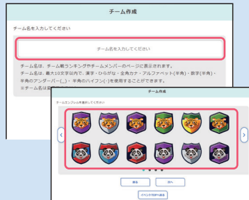
② 画面の指示に従い「チーム名」「チームエンブレム」を設定。